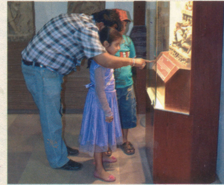
अनुवाद : सन्ध्या द्विवेदी, चित्र एवं छायाचित्र : मेनुअल जोसफ

हमारी गौरवशाली धरोहर को आवी पीढी तक पहुँचाना हमारा नैतिक कर्तव्य है